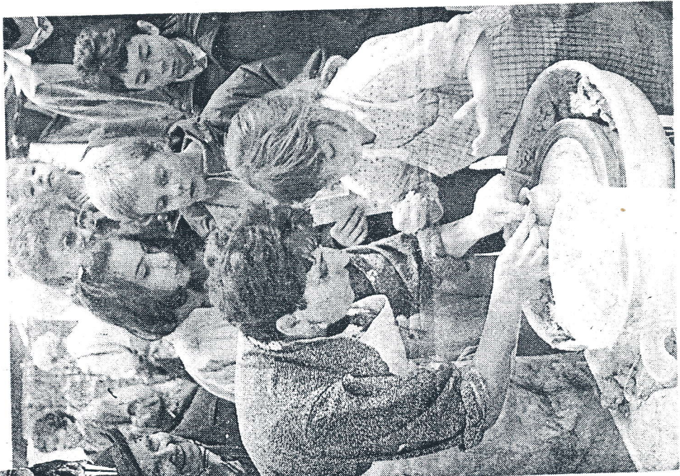
« Madame, comment tu fais tes poteries ? »

Le rendez-vous organisé ce week-end au Parc des Expositions par l'Association professionnelle des artisans créateurs des Vosges a fermé ses portes hier soir à 20 h. Pour bon nombre de visiteurs, ce fut l'occasion de penser, déjà — mais le temps passe si vite — aux cadeaux de fin d'année.